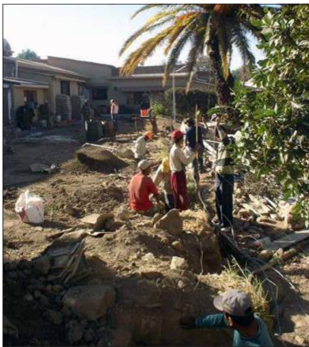
Limpiando y preparándose para comenzar.