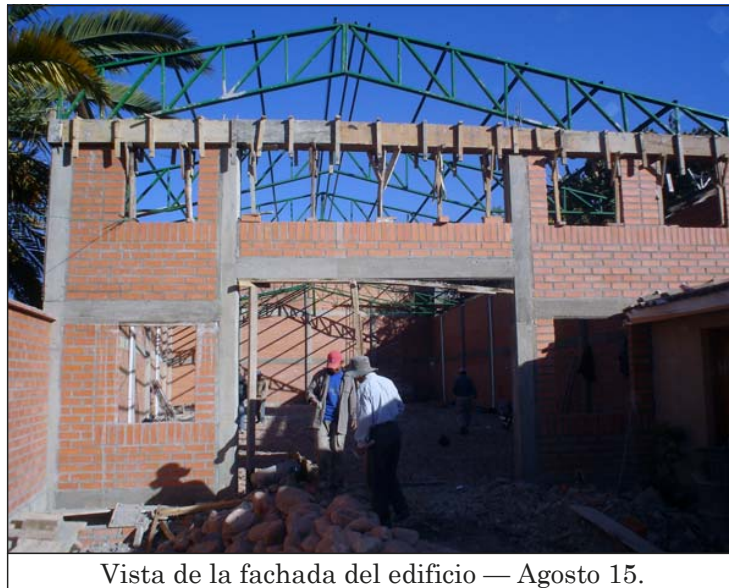
Vista de la fachada del edificio — Agosto 15.

El equipo de liderazgo consideró que esto era una señal de que ya era hora de dar un paso de fe y