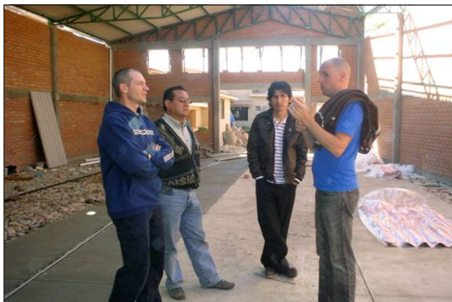
Paredes, techo y piso, todas casi terminadas!

comenzar a construir su propia sala de reuniones - aunque no tenían suficiente dinero. Y se habían comprometido a no prestarse fondos.