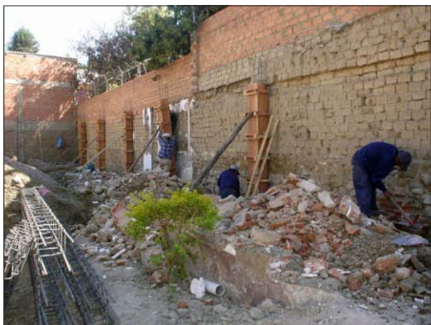
La construcción está en marcha — Julio 7!

ce. No sólo los pastores se encontraban en el hospital para orar y animar a Alejandra y su mamá, CIC también ayudó a cubrir parte del costo de la cirugía.